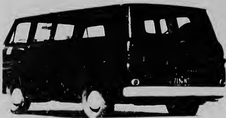
ORLANDO, FLORIDA--Riba e portret aki nos por mira con un "Rocket Chair" ta ser di test, cual lo permiti astronautanan circula den espacio.